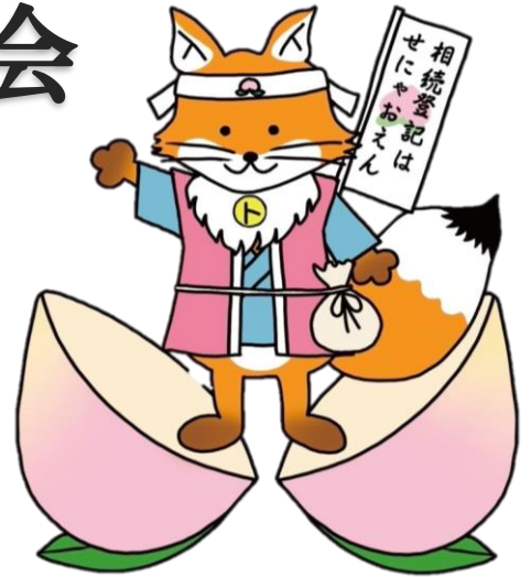
不動産登記推進イメージキャラクター 「ご当地トウキツネ」